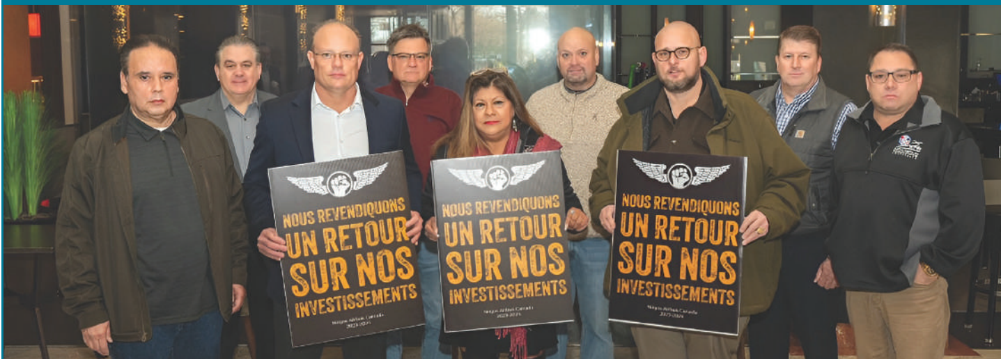
Les membres du Conseil exécutif de l'IAM le Syndicat brandissent des pancartes en soutien aux membres de la section locale 712

En mai 2024, les membres de la section locale 712 de l'IAM travaillant pour Airbus Canada ont voté à 77,14 % en faveur de leur nouvelle convention collective, avec près de 81 % des 1 300 travailleurs participant au vote. Le contrat intègre les changements proposés par le conciliateur ainsi que la plupart des conditions de l'entente de principe du 21 avril. La convention était la meilleure de l'industrie, mais elle comportait de sérieux problèmes.