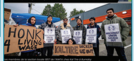
Les membres de la section locale 1857 de l'IAMTA, chez Kal Tire à Burnaby